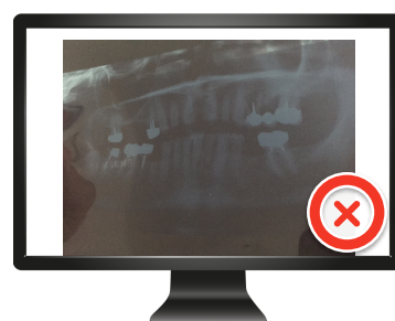
IMAGE SOMBRE OU FLOUE